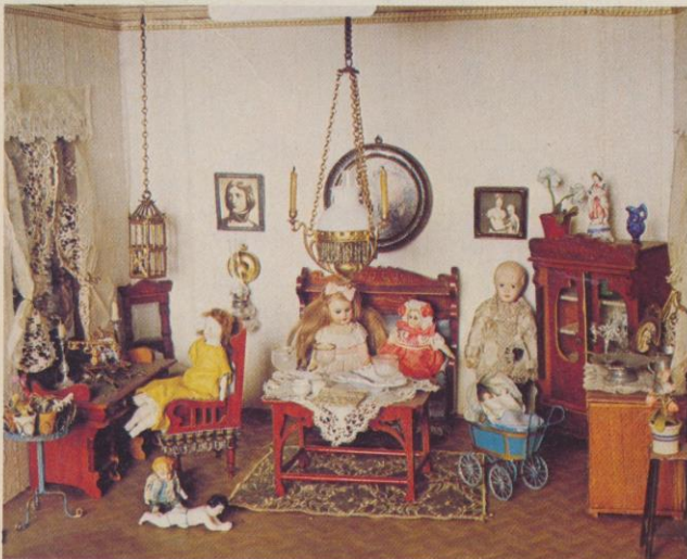
Interiör från dockskåp tillverkat ca 1900 med möblemang i jugend och fotogenlampor.