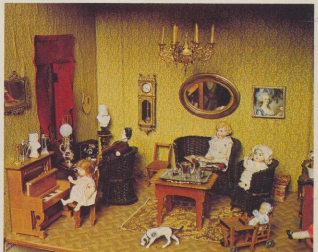
Barnstol, radio, statyetter, piano, allt som fanns i verkligheten återfanns i dockskåpet. Interiör från dockskåpet från 1909.