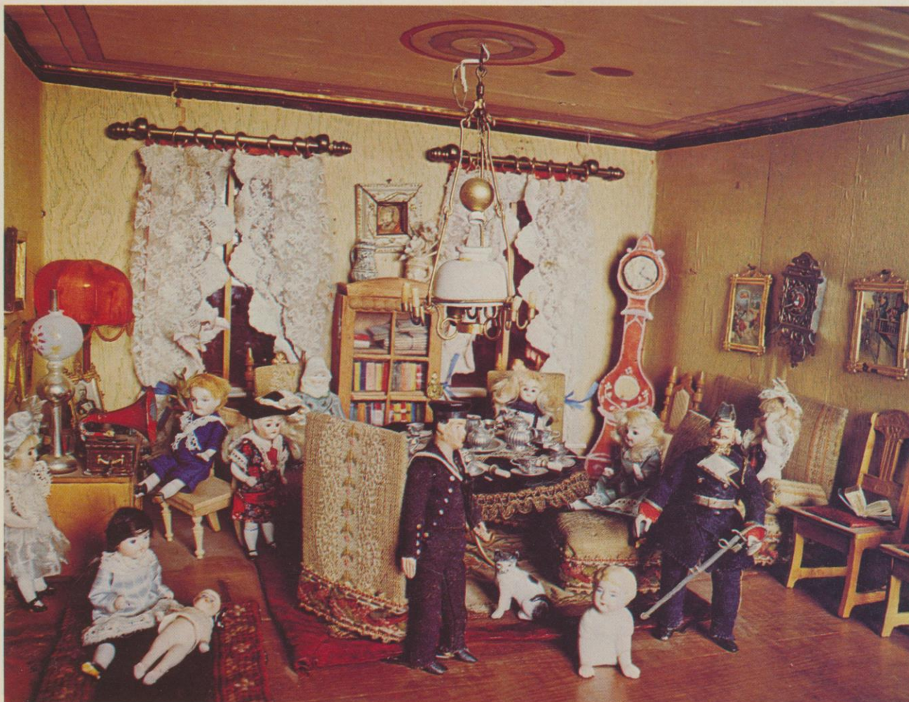
Interiör från dockskåp från 1909. I nedre salongen hålls ett kafferep. Yngste sonen lyssnar på trattgrammofon medan pappa ami-

ralen försöker göra sig hörd i sitt samtal med äldste sonen, som gör sin värnplikt i Kgl. Flottan.