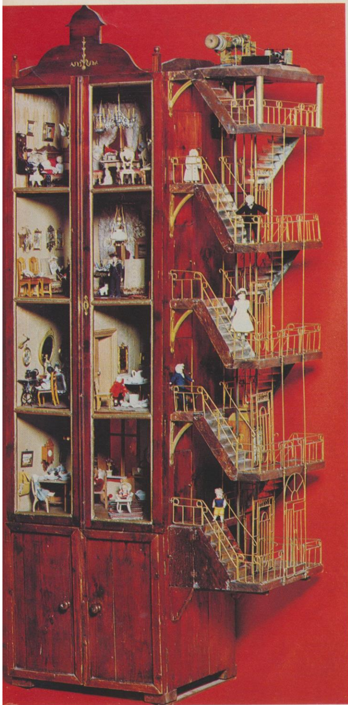
Dockhus från 1909 tillverkat i Stockholm. Huset är i fyra våningar och har en riktigt fungerande elektrisk hiss. Trappuppgångarna är i jugendstil. Huset är byggt i tidens anda och saknar inga moderna bekvämligheter. Höjd 196 cm. Bredd 80 cm.