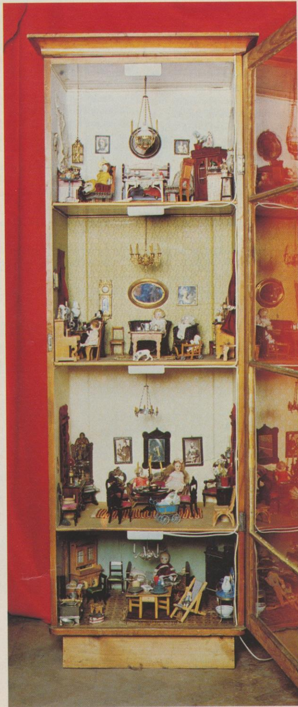
Dockskåp av omändrat klädkåp ca 1900. Möbler och tillbehör är här i den större skalan. Höjd 193 cm. Bredd 60 cm.