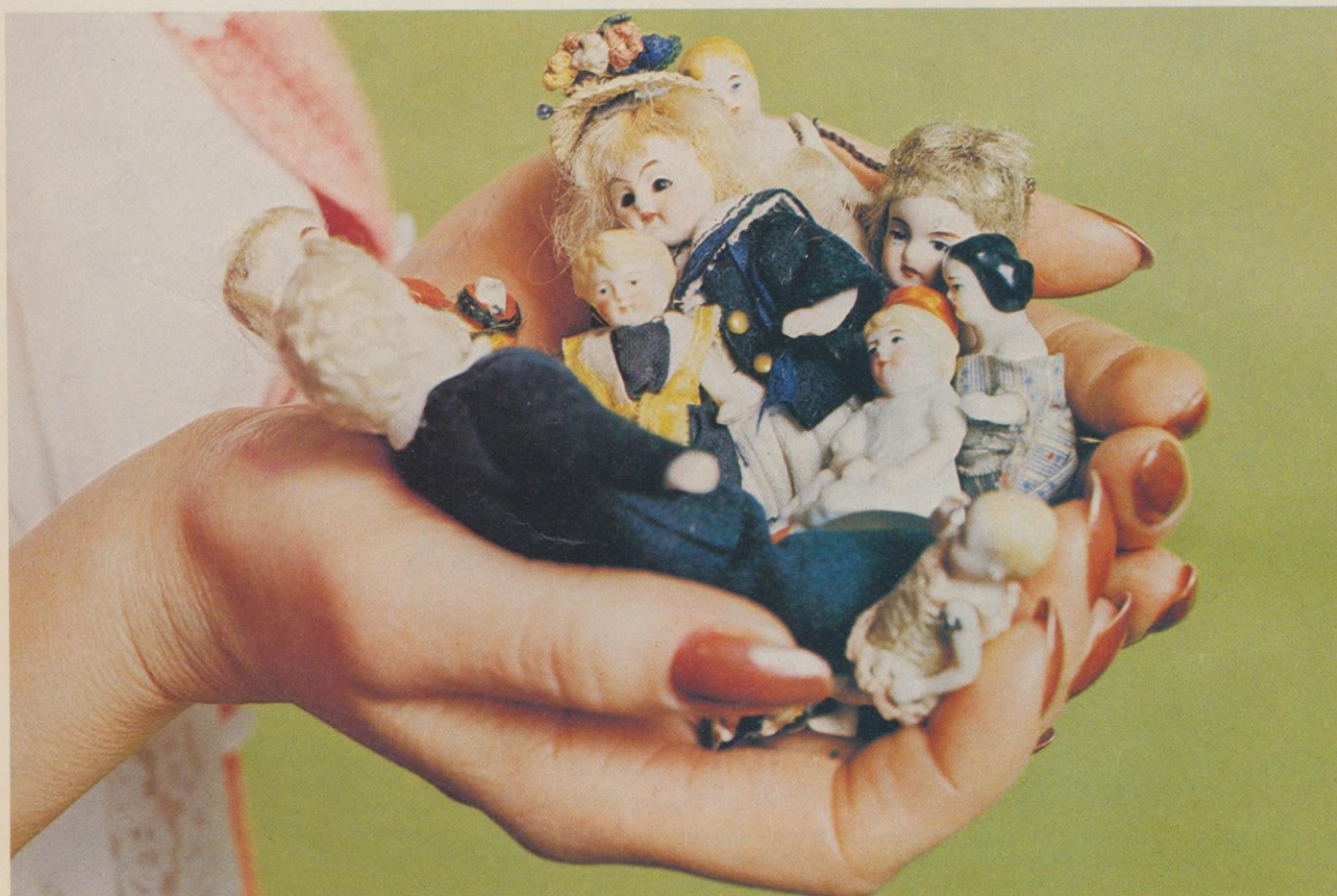
En samling porslinsdockor, de flesta av tysk tillverkning 1880—1900.

Marion O'Brian: The collector's guide to Dollhouses and Doll miniatures.